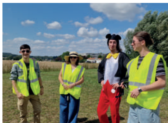
Prestation de danse du groupe Flash Dance