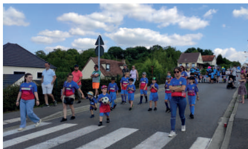
US Foot de Vénizel