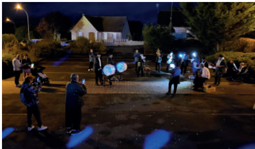
Retraite aux flambeaux