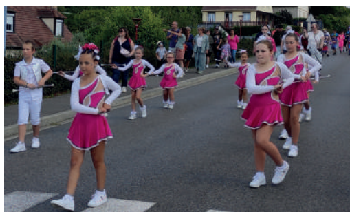
Les étoiles d'argents