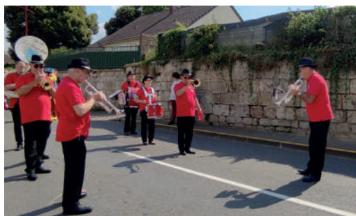
Batterie fanfare «Les Dauphins»