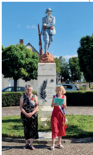
Commémoration au monument aux morts. Retrouvez le discours de Madame le Maire en annexes